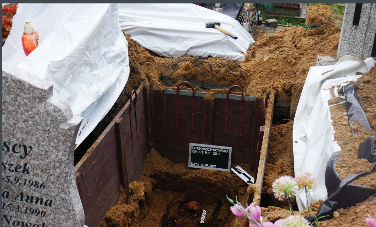
| Prace poszukiwawcze IPN w Bydgoszczy