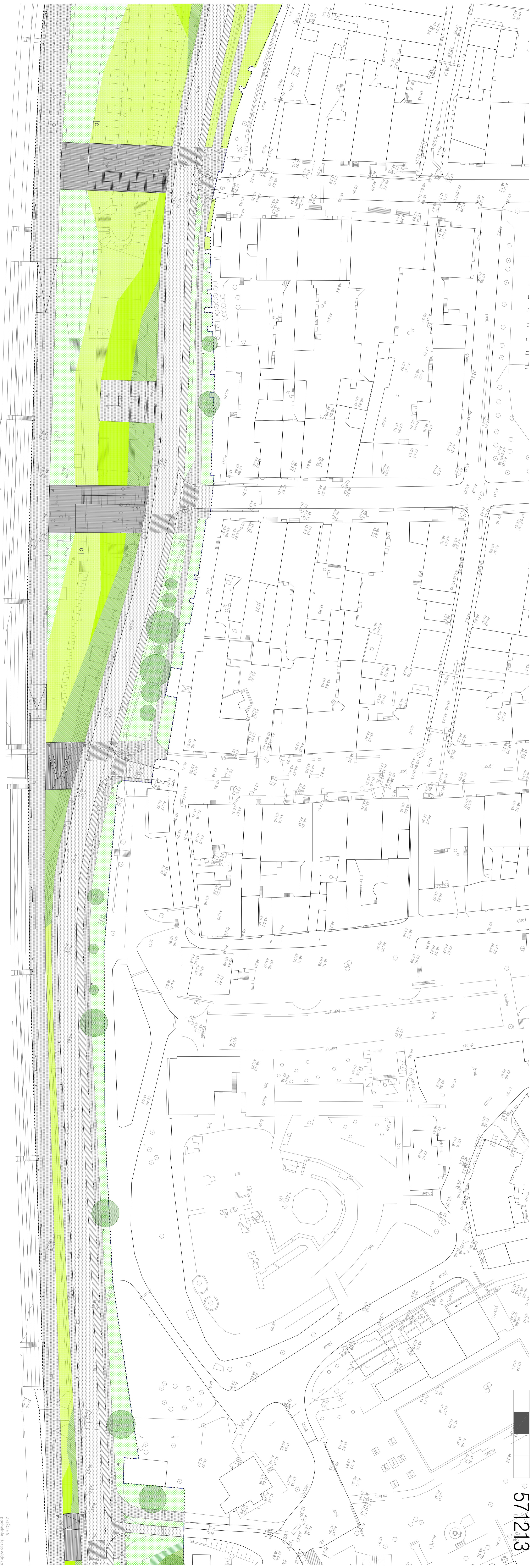
ZDZIAŁ 1 - studium lokalizacji - na składowiska