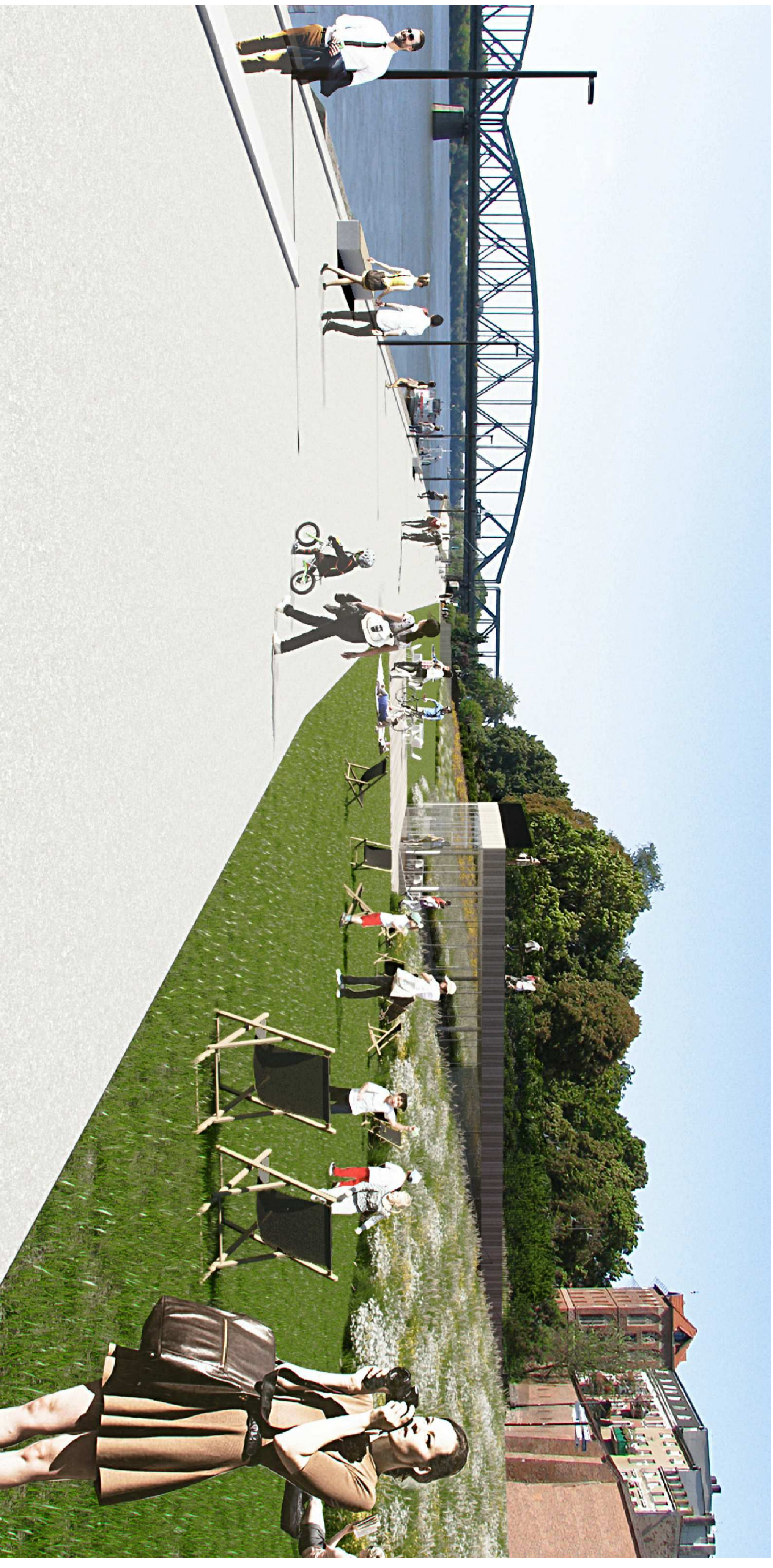
WIDOK Ciepłarni Głębokości Biłgoraj - koncepcja ulicy Zielarskiej - wzniesienie